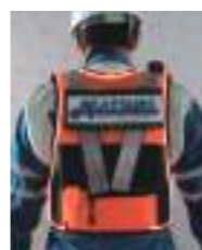
ELファイバー点灯時