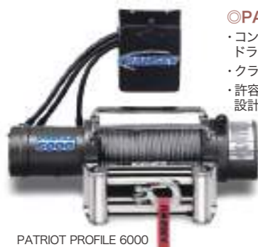
PATRIOT PROFILE 6000